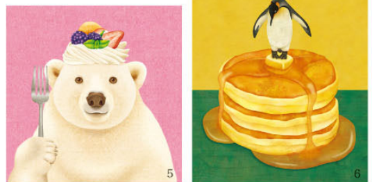
1,2.「いい出来ばえ」/3.「Pattern～しまうま」/4.「カラフル帽子」～こねことぼんシリーズより/5.「召し上がれ」/6.「溶けていくバターの上で」