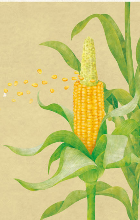
「スイートコーン×ポップコーン」2023